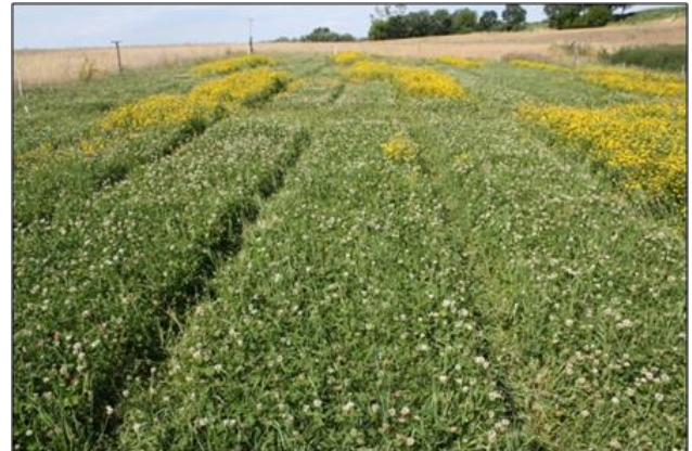
Ökologisches Versuchsfeld vor dem 2. Schnitt 2015

Beide Befunde weisen auf die realistische Möglichkeit hin, unter hiesigen Bedingungen eine moderate P-Düngung zur Förderung der Grünlandleguminosen ohne markant negative Auswirkungen auf die Phytodiversität zu rechtfertigen und damit auch zu praktizieren.